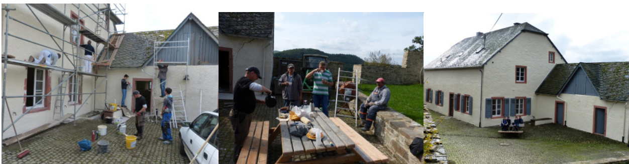
Viel Betrieb auf der Baustelle,