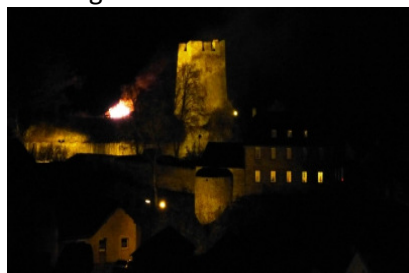
Das Feuer auf der Burg