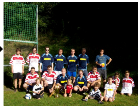
die Sieger und Verlierer →