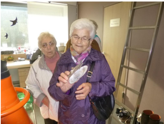
... die Flußperlmuschel