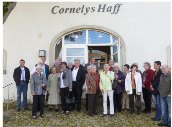
in Heinerscheid am Cornelys Haff

Anregungen, Kritik, Ideen, Infos, Fragen bitte an: